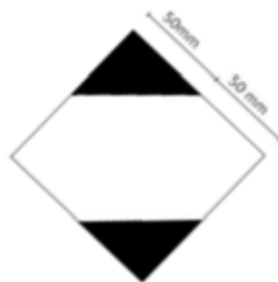
Fig. 1 Marca para los envases y/o embalajes que contengan cantidades limitadas.

De acuerdo a la NOM-011-SCT2/2012: 5.11 No será necesario que los envases y/o embalajes que contengan sustancias o materiales peligrosos en cantidades limitadas, lleven la Designación Oficial de Transporte ni el número de identificación UN de su contenido (Naciones Unidas, por sus siglas en inglés), pero deberán llevar la marca que aparece en la Figura No. 1. La marca debe ser claramente visible, legible y debe ser capaz de resistir (soportar) la exposición a la intemperie sin degradación alguna.).